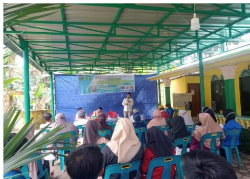
Gambar 1. Pelaksanaan program pengabdian kepada masyarakat di dusun I

Pengabdian kepada masyarakat ini dilaksanakan pada tanggal 28 Agustus 2021 di Dusun I Desa Tanjung Keliling Kecamatan Salapian Kabupaten Langkat. Luas desa ini 17,75 km 2 , jumlah penduduk 2.586 jiwa, jenis kelamin laki-laki sebanyak 1.249 sedangkan perempuan 337. Di desa ini terdapat 12 dusun, 921 kepala keluarga. Adapun laju pertumbuhan sebesar 0,4% dengan profesi warga di lokasi adalah petani. Mayoritas sebesar 90% warga dusun 1 beragama Islam (wawancara dengan Sariono). Sehingga materi pengabdian kepada masyarakat dengan judul “Membangun Ketahanan Keluarga Yang Rukun, Harmonis Dan Romantis” bernafaskan Islam, mengangkat perspektif Islam berdasarkan realitas yang terjadi di masyarakat dan lokasi pelaksanaannya di pelataran masjid dusun Al-Ikhlas di dusun 1 ini. Berikut ini sepenggal dokumentasi penyuluhan dan pembekalan yang disampaikan narasumber dan tim.